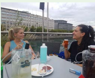
Apéro estival au Bateau-Lavoir