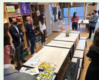
Visite de la start-up Enoki

Une année particulière en quelques mots :